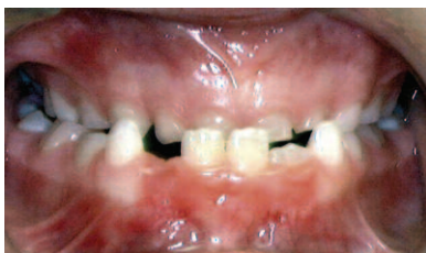
MORDIDA ANTERIOR CRUZADA

Los dientes de la arcada inferior están por delante de los superiores cuando los dientes posteriores están en contacto