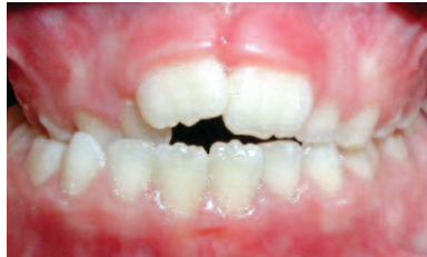
MORDIDA CRUZADA POSTERIOR

Dientes de arriba se encuentran por detrás de los de abajo