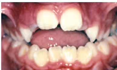
MORDIDA ABIERTA ANTERIOR

Poco espacio para los dientes permanentes