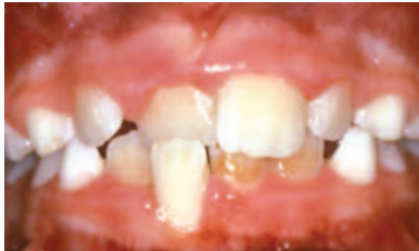
MORDIDA CRUZADA ANTERIOR

Maloclusiones (“malas mordidas”) ilustradas en esta página, pueden beneficiarse con un diagnóstico temprano y ser referidos a un especialista en ortodoncia para recibir una evaluación completa.