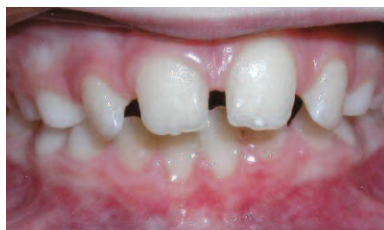
ESPACIOS ENTRE LOS DIENTES

Los dientes de la arcada inferior están por delante de los superiores cuando los dientes posteriores están en contacto